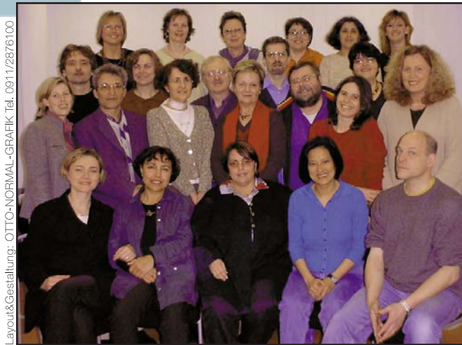
Layout&Gestaltung: OTTO-NORMAL-GRAPHIK Tel. 0911/2876100