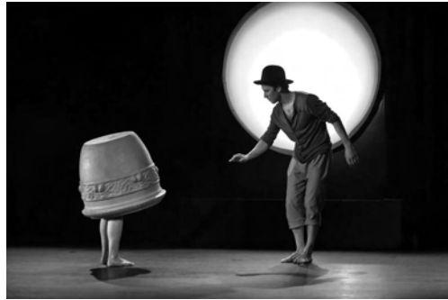
Szene aus „Ilo“

Die dritte belgische Gruppe im Festival ist die „Cie. Gare Centrale's Squatting Poetic“: in „Fragile (Zerbrechlich)“