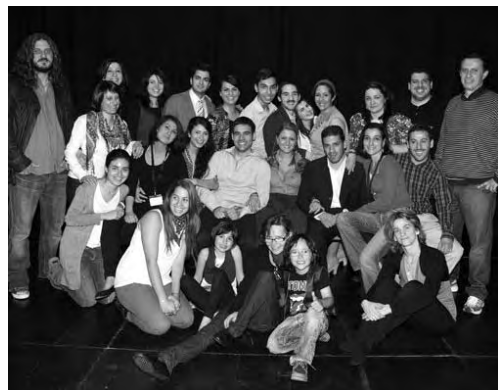
Das Ensemble von „Fremde Heimat“

Die Regierung von Mittelfranken wollte in diesem Jahr Gruppierungen und Projekte auszeichnen, die sich der Förderung der (inter)kulturellen Verständigung und Toleranz widmen. Der 2. Preis ging an die Christlich-Islamische Arbeitsgemeinschaft Erlangen, ein 4. Preis an das Projekt „Leben in Deutschland“ des Katholischen Erwachsenenbildungswerk Treuchtlingen.